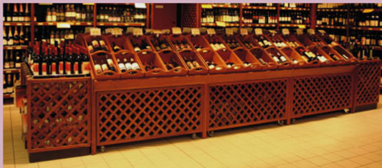
Ejemplos de composición.