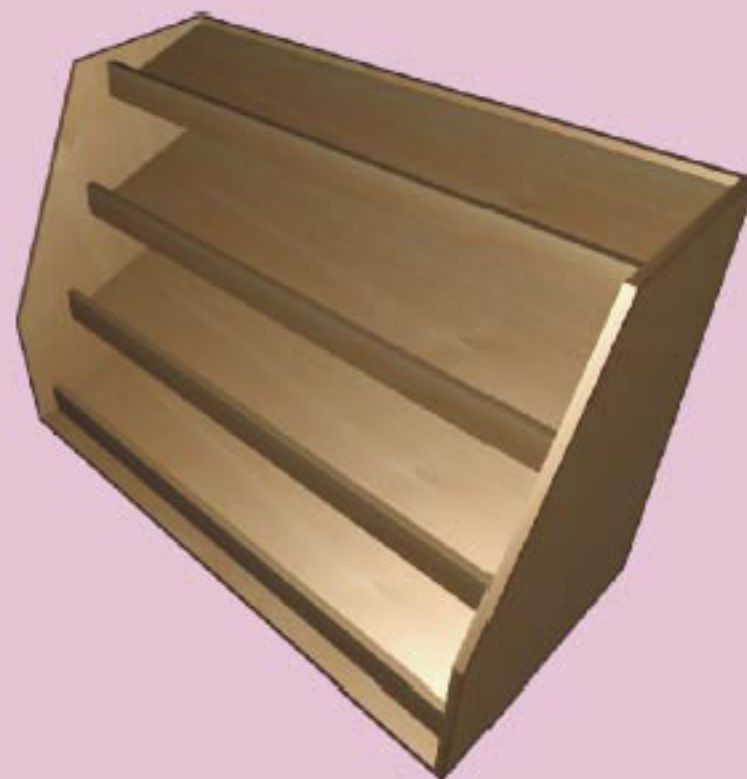
Capacidad del expositor 48 botellas