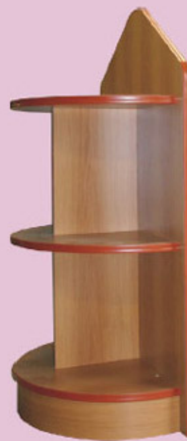
Cabezal para el expositor de vino.