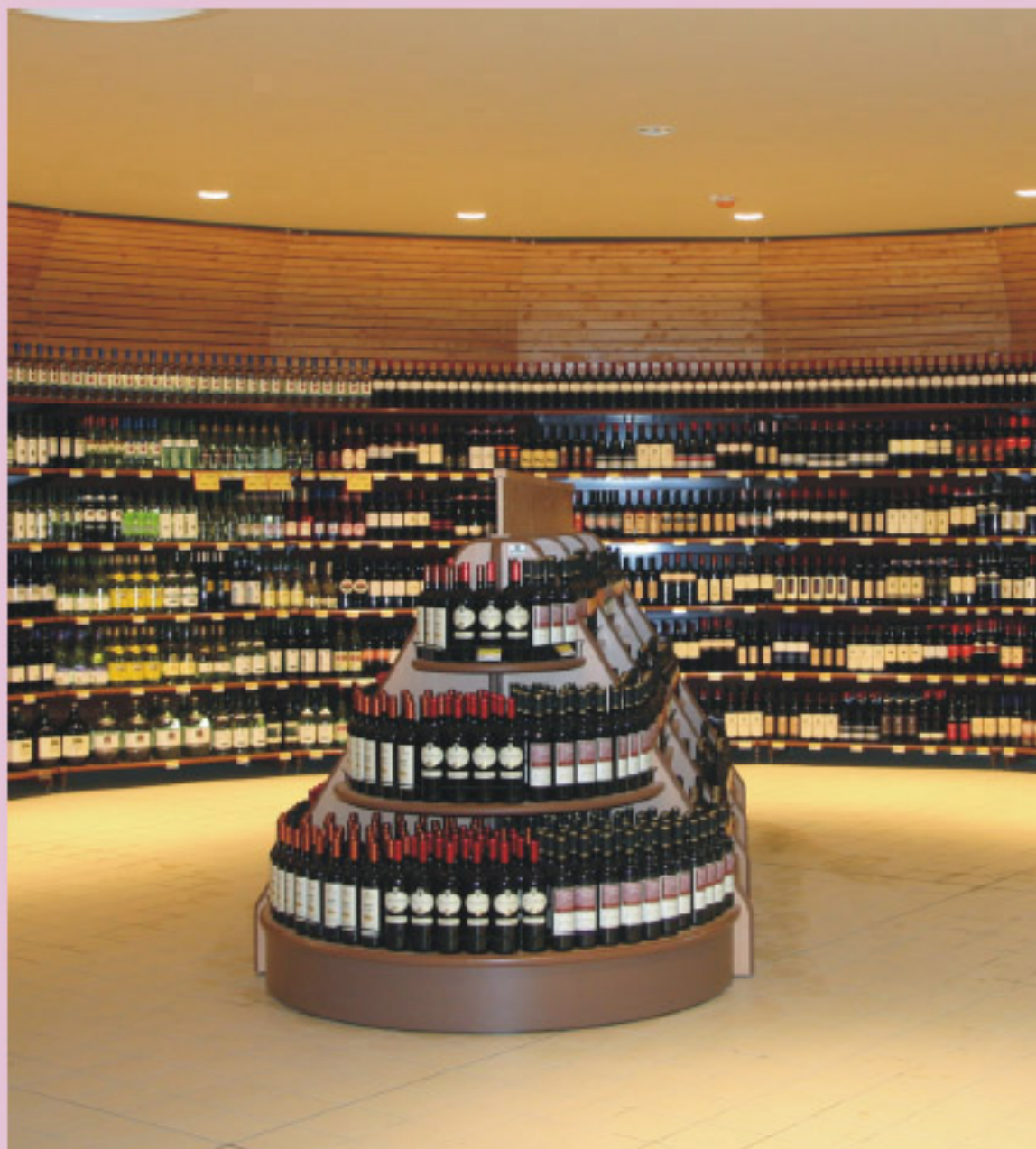
Cabezal de la Góndola