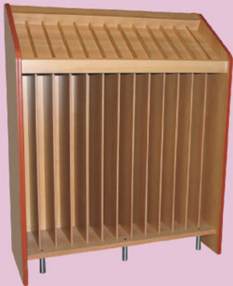
Expositor de vino de 1000 m/m. y de 1300 m/m.

Expositor para botellas de vino colocadas, verticales o inclinadas.