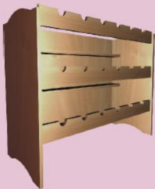
Capacidad del expositor 18 botellas.