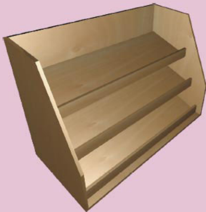
Capacidad del expositor 36 botellas